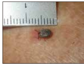
マダニのサイズは約6mm

無理に引き抜こうとせず、医療機関で処置してもらいましょう。その後数週間程度は体調の変化に注意し、もし発熱などの症状があればすぐに受診してください。