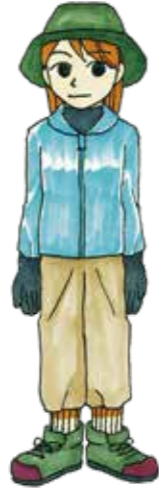
東京都健康安全研究センター 推奨「マダニ防止のための服装」

草むらに入るのはできるだけ避けましょう。 どうしても入らないといけない場合は、長袖・長ズボン・手袋などを着用し、できるだけ肌の露出を少なくしましょう。さらに、淡い色を着用すれば服に付いたダニを見つけやすくなります。