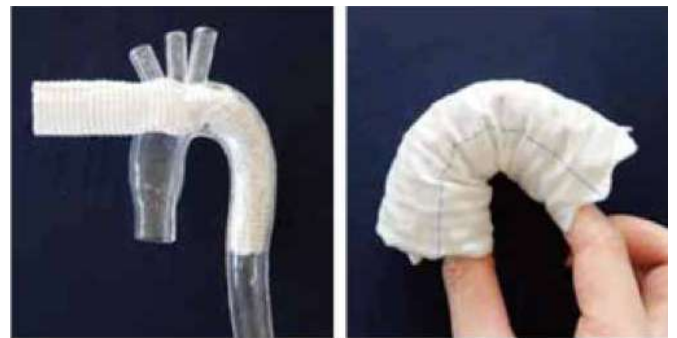
弓部に無理なく沿う屈曲追従性・密着性