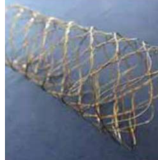
フレキシビリティを生み出す独自のデザイン

弓部大動脈手術時に下行大動脈吻合をステントグラフトによる固定で代用する手技。人工血管移植範囲を広範囲に設定できるメリットがある。