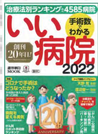
手術数でわかるいい病院 2022 朝日新聞出版 2022年3月10日発行