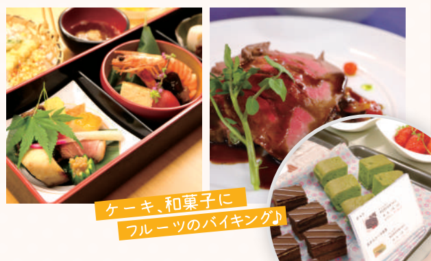
ケーキ、和菓子に フルーツのバイキング♪